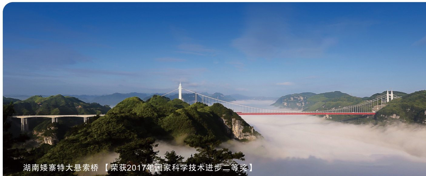
湖南矮寨特大悬索桥【荣获2017年国家科学技术进步二等奖】

核心实力强劲 持有国家工程勘察综合类、公路全行业、水运全行业、市政行业(含道路工程、桥梁工程、城市隧道工程、公共交通工程、轨道交通工程)、建筑行业(建筑工程)、风景园林专项等6大类甲级勘察资质证书及国家工程咨询、工程测量、试验检测、地质灾害防治等4大类甲级资质及资信。